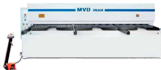
MVD ISHEAR "A" SOROZATÚ MECHANIKUS LEMEZOLLÓ GÉP