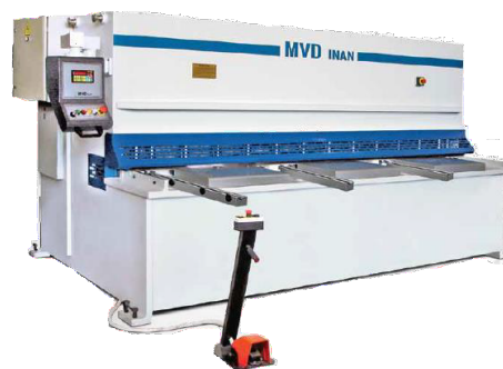
MVD ISHEAR "A" SOROZATÚ MECHANIKUS LEMEZOLLÓ GÉP